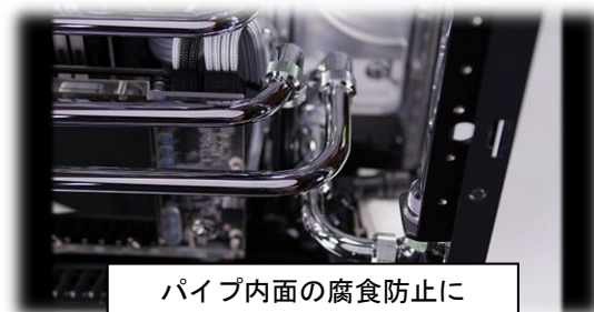
パイプ内面の腐食防止に